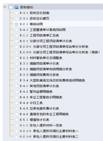
图 1: 广东 24 清单报表规范

答：本项目提供的招标工程量清单，为本项目所需报价格式。若投标人有其他定制化报表（如分项汇总、进度对比或成本分析等）需求，请自行按实际需求进行补充。